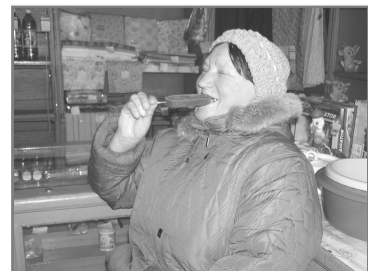
Когда сильно хочется сладкого, почему бы не съесть только что купленное мороженое прямо тут, в магазине?