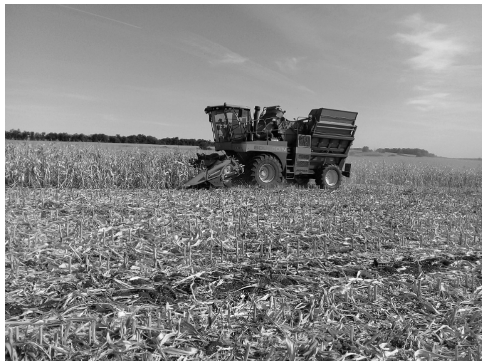
Уборка кукурузы на силос.

В этом году особые усилия аграриев потребовались в заготовке кормов. Из-за засухи продуктивность кормовых угодий была низкой. А, между тем, на предстоящую зимовку нужно было по максимуму сформировать кормовую базу для животноводства. Полеводы использовали все резервы, чтобы выполнить эту задачу. Помогла, конечно, и дополнительная поддержка, выделенная на эти цели, — 347 млн. рублей федеральных и краевых средств.