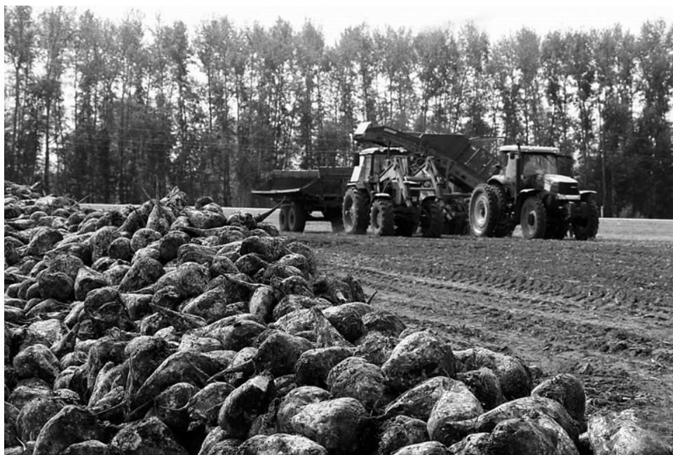
Урожайность сахарной свеклы в этом году стала абсолютным рекордом за всю историю ее возделывания в регионе — 511 центнеров с гектара.