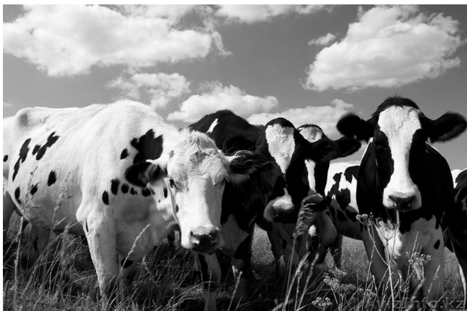
В регионе продолжают работать программы по поддержке начинающих фермеров и семейных животноводческих ферм.