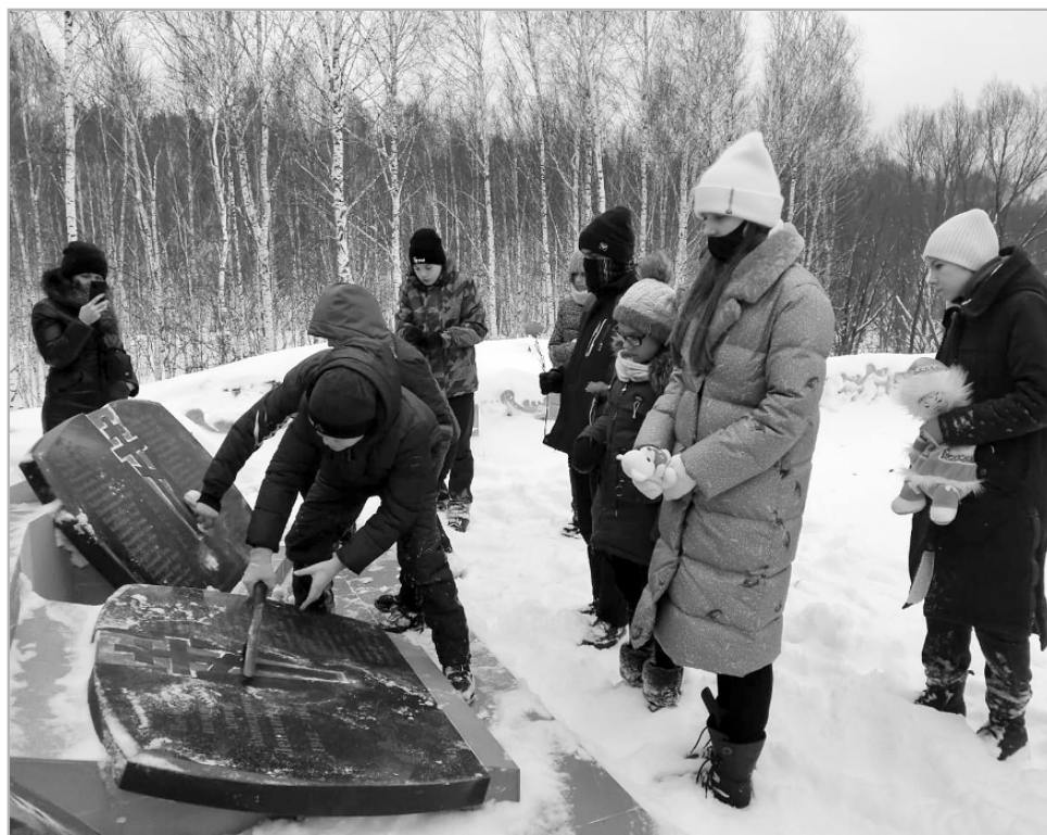
Посещение мемориала произвело на школьников из райцентра неизгладимое впечатление.

М. КУЦУБА, заведующая детской библиотекой.