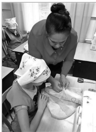
В швейной мастерской.

время возглавляли профсоюзную организацию школы. Люди, чья активная жизненная позиция помогла первичке пережить сложные времена.