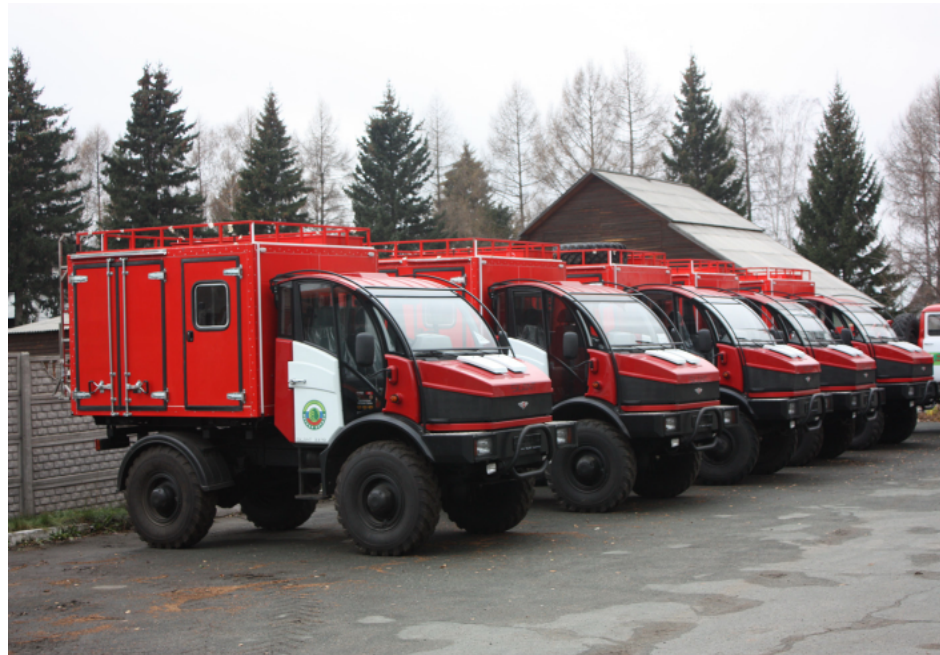
Новые лесопожарные комплексы приобретены в 2011 году.

нарушение населением правил пожарной безопасности на природных объектах. А ведь все мы, жители края, на собственном примере хорошо помним, чем страшен распространившийся в больших масштабах огонь. Я говорю о трансграничном лесном пожаре, который пришел в регион в 2010 году из Казахстана. Тогда огнем практически стерто было с