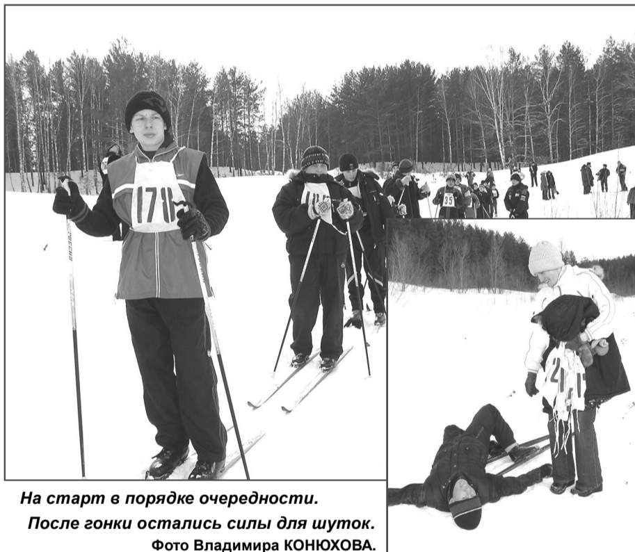
На старт в порядке очередности.