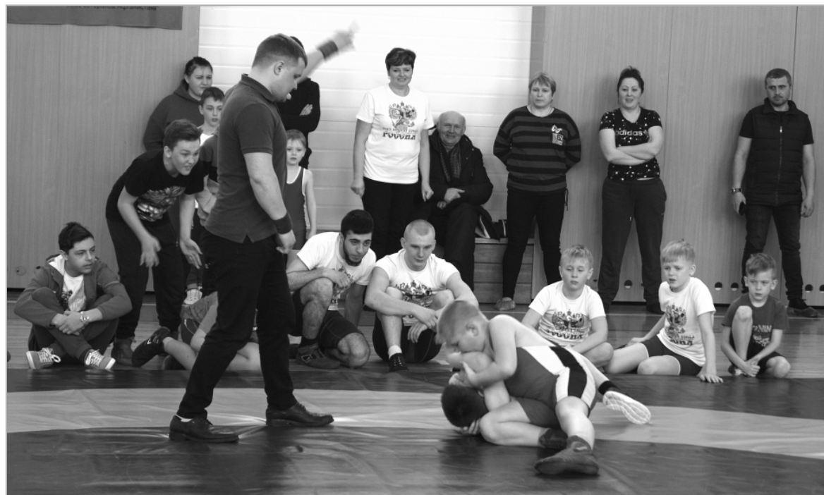
За поединком наблюдают болельщики — безучастных нет!

ВНИМАНИЕ! Ознакомьтесь со списками участников войны Южакковского сельсовета (ранее он включал в себя п. Многоозерный, п. Лесной, с. Южаково) можно на сайте районной газеты или в группе «Многоозерный» соцсети «Одноклассники».