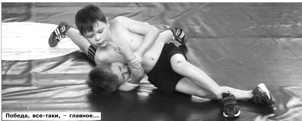
Победа, все-таки, — главное...