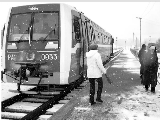
Вслед за Калининградской и Читинской областями в Алтайском крае появился первый рельсовый автобус с современным дизайном.

– Если пассажир едет с маленьким ребенком, а в автобусе нет туалета, что делать? Как можно решить этот вопрос?