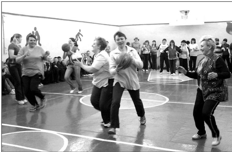
«Ты – мне, я – тебе». Главное в эстафете – не подвести товарища.

Подводя итог соревнований, жюри определило, что с одинаковым количеством баллов первое и второе места разделили «Кеды» и «Ту-