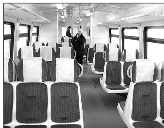
Пассажирам предстоит оценить комфорт авиационных кресел в салоне автобуса.

– Сейчас график движения дорабатывается до оптимального, ведь по этой ветке, кроме автобуса, идут и другие пассажирские и грузовые поезда. В дальнейшем время в пути может сократиться, и доехать от Большой Речки до Барнаула можно будет еще быстрее.