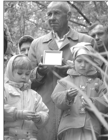
«...Отче священноначальниче Николае, моли Христа Бога спастись душам нашим», — взрослые и дети смиренно творили молитву, несмотря на полчища комаров...

К источнику пришли мужчины, женщины, дети. Многие матери принесли младенцев. Как ни странно, но, несмотря на все неудобства, дети не капризничают. Совсем маленькие тихо посапывают на руках у мам, те, что постарше, смиро-