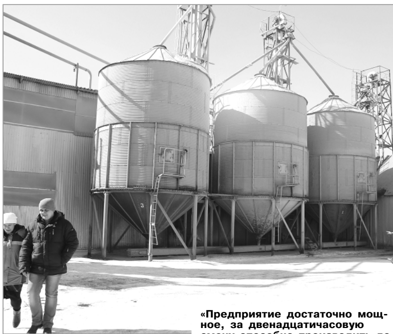
«Предприятие достаточно мощное, за двенадцатичасовую смену способно производить до 13 тонн готовых круп», — говорит директор ООО Торговый Дом «Нива» Николай Щелкунов (на фото справа).

Поступающее зерно весом выгружается из автомобилей в завальную яму, затем подается в специальные накопители для хранения объемом до 200 тонн. Далее зерно шнеками закачивается в промежуточные емкости. После происходят процессы обшелушивания, шлифовки, сортировки по фракци-