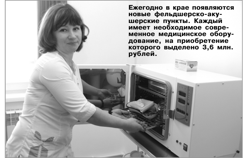
Ежегодно в крае появляются новые фельдшерско-акушерские пункты. Каждый имеет необходимое современное медицинское оборудование, на приобретение которого выделено 3,6 млн. рублей.

—Он приобретен в рамках социального партнерства и находится на балансе здравоохранения Целинного района. Первый мобильный фельдшерско-акушерский пункт уже доказал свою эффективность в решении проблем доступ-