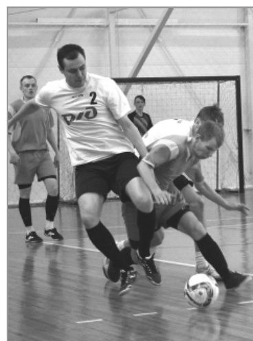
Острых моментов на турнире было немало.

Троицкие команды «Смена» и «ДЮСШ», к сожалению, призы взять не смогли, им достались четвертое и пятое места соответственно, а замкнули таблицу представители Косихинского района.