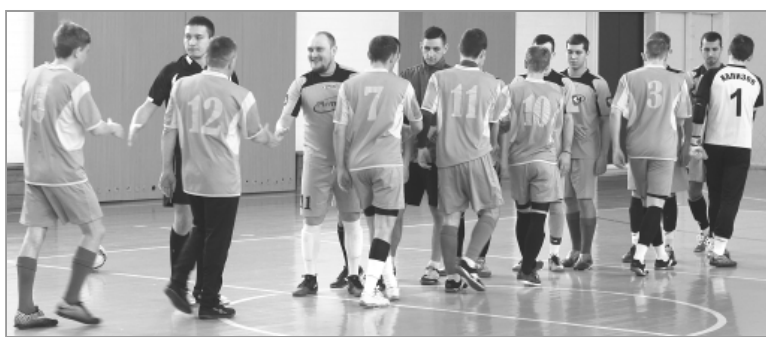
Дружеское рукопожатие футболистов перед встречей.