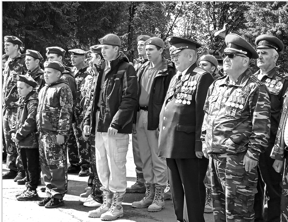
Глядя на ряды участников митинга, состоявшегося 22 июня у мемориала Воинской славы в райцентре, мы отчетливо видим связь поколений.

Стало уже традицией отмечать памятные даты, связанные с событиями этой войны, шествием со свечами. В поселке Многоозер-