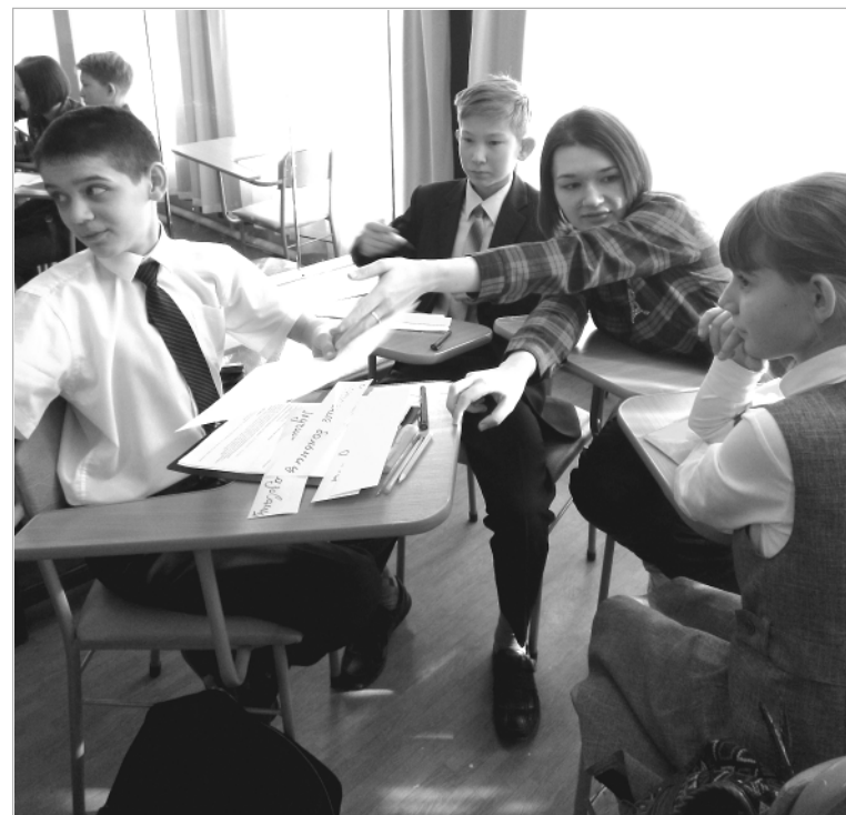
Один из моментов конференции. На фото — делегация Троицкой средней школы №1.