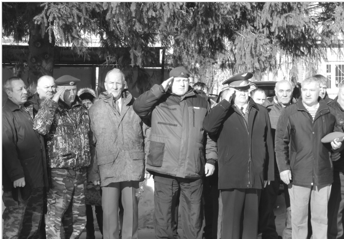
Минута молчания в память о погибших и безвременно ушедших из жизни в мирное время товарищах...

У мемориала памяти – солдаты и офицеры войсковой части №85906 (Космические войска).