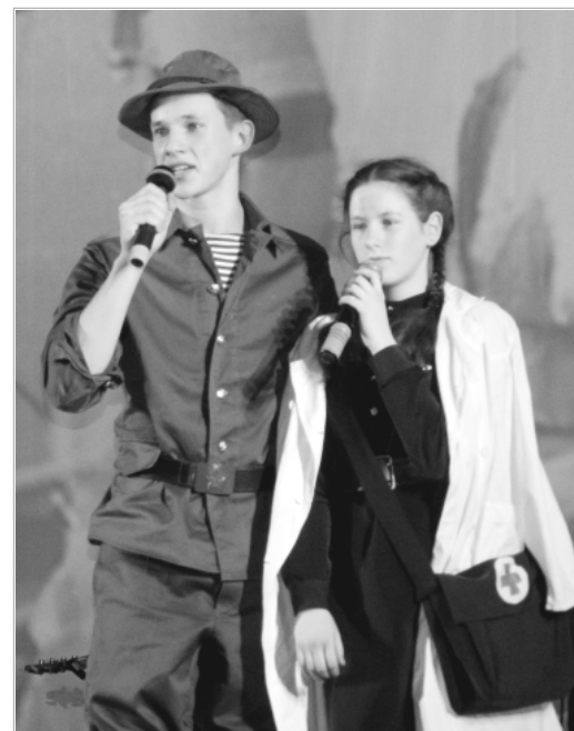
Эмоциональный накал во время выступления ребят из Пролетарской школы был настолько силен, что некоторые зрители не могли сдержать слез.