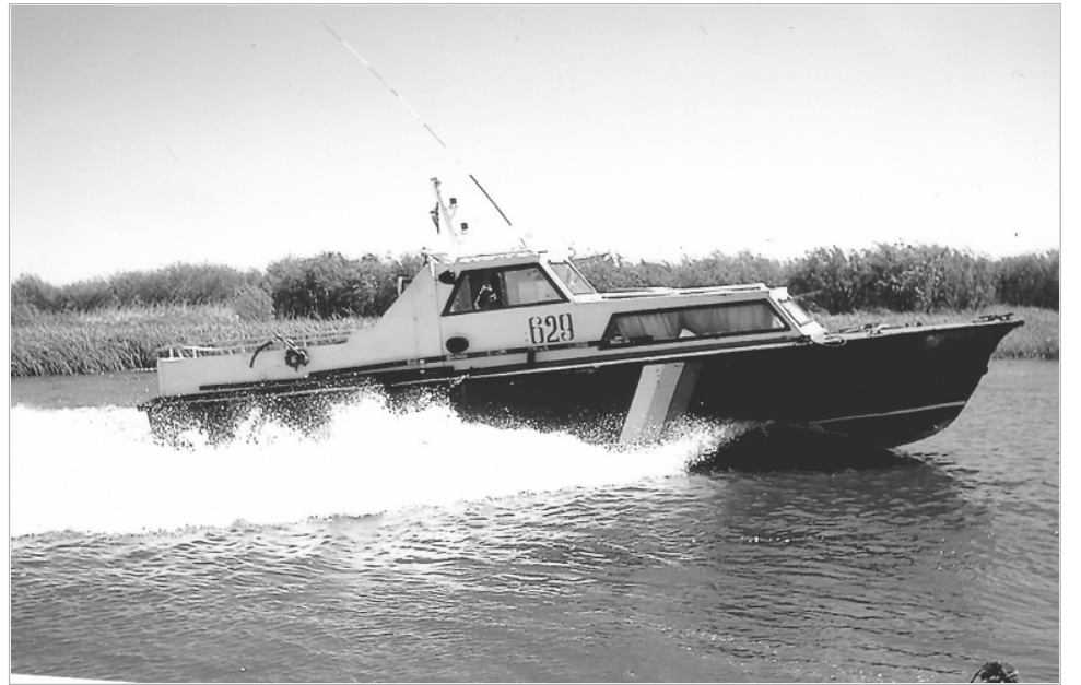
На патрулировании российско-китайской границы – пограничный катер «Аист».

–Наши командиры, офицеры были толковыми профессиональными военными и хо-