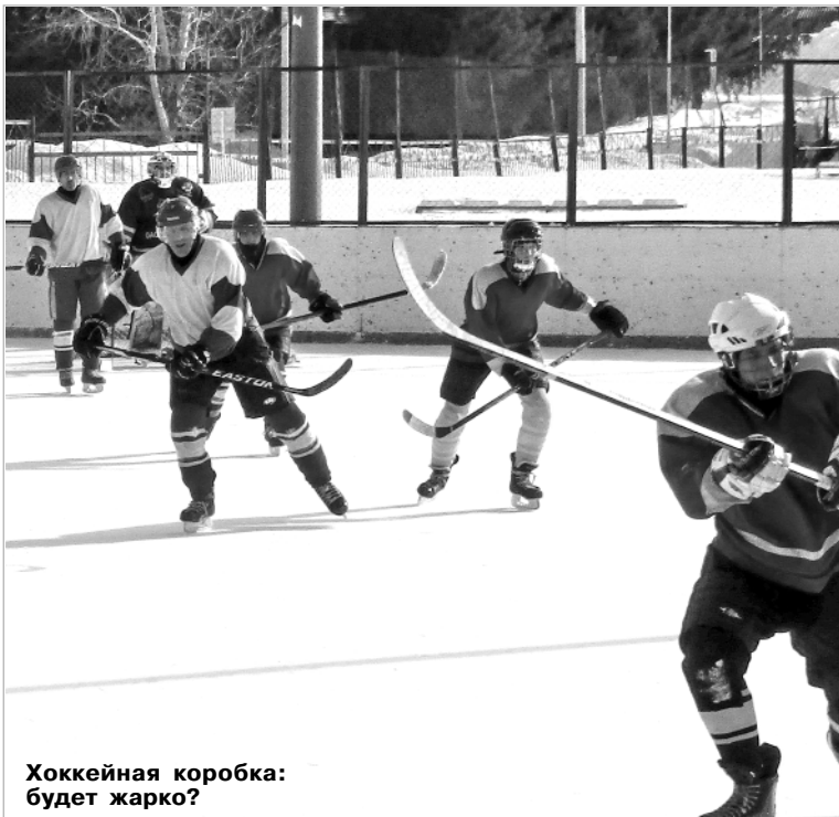
Хоккейная коробка: будет жарко?