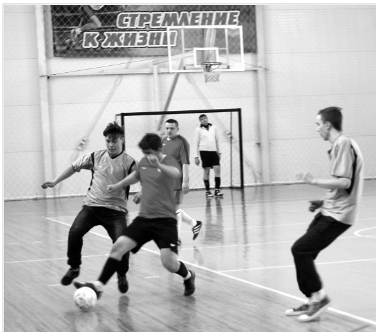
Игра команд «Динамо» и агротехнического техникума.