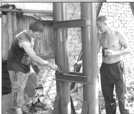
Покраска металлических конструкций – это уже последний штрих, испортить его нельзя. Поэтому так стараются студенты, которые решили подработать здесь на каникулах.

лесорамам, оборудованным в цехе. – Обратите внимание, у нас здесь нет ничего старого – все оборудование: рамы, кранбалки, станки – все приобрели заново. Затраты лес-