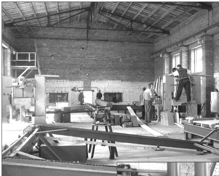
Монтаж оборудования завершен, но его надо «обкатать», устранить заводские недоделки. Этим и заняты работники, которым предстоит его эксплуатировать.