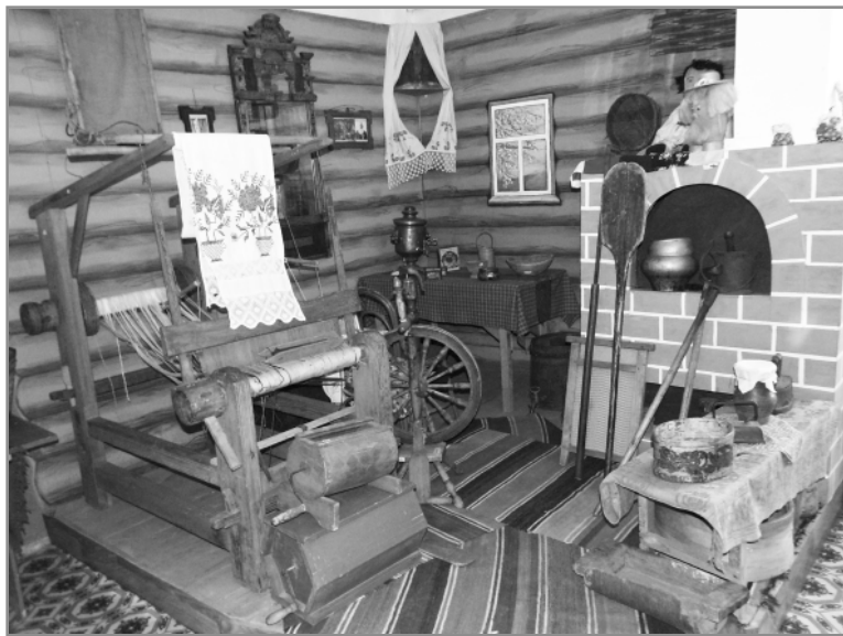
Экспозиция «Крестьянское хозяйство и быт».

висимую оценку качества оказания услуг с оценкой «отлично».