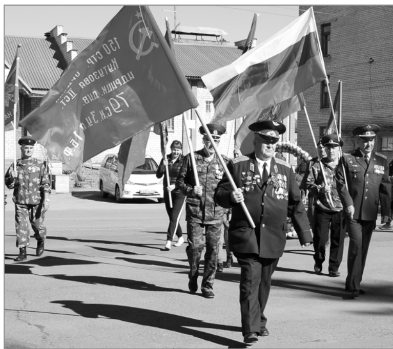
Копия Знамени Победы через несколько минут взметнется на флагштоке.

стал праздником широкой русской души, потому что 75-летие Победы бывает только раз. Пусть молодежь помнит, что отцы и прадеды, дедушки и бабушки отстояли страну. Это нужно помнить всегда.