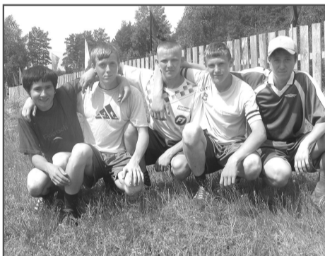
Футболисты – легкоатлеты. Представители команды хозяев олимпиады.