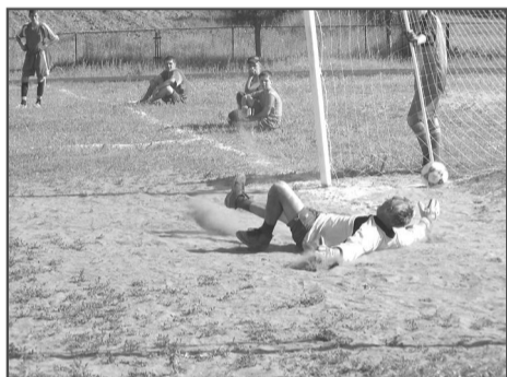
Серия пенальти: мяч в воротах «Факела».