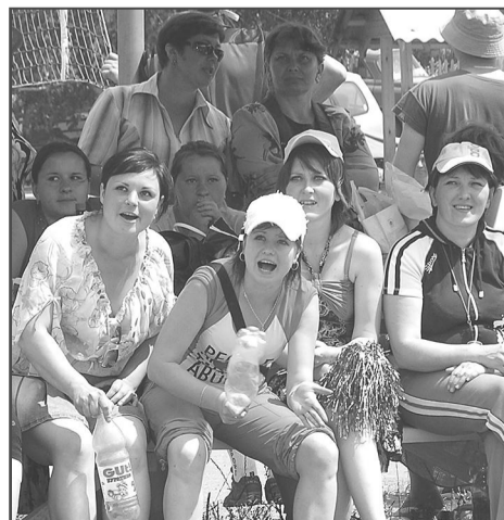
«Мы всей душой бодем за своих!»