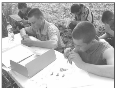
Теоретические вопросы вроде и несложные, но под пристальным вниманием собравшихся сосредоточиться нелегко.