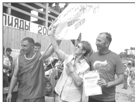
Команда «Факел» заняла первое место по Троицкой сельской администрации.