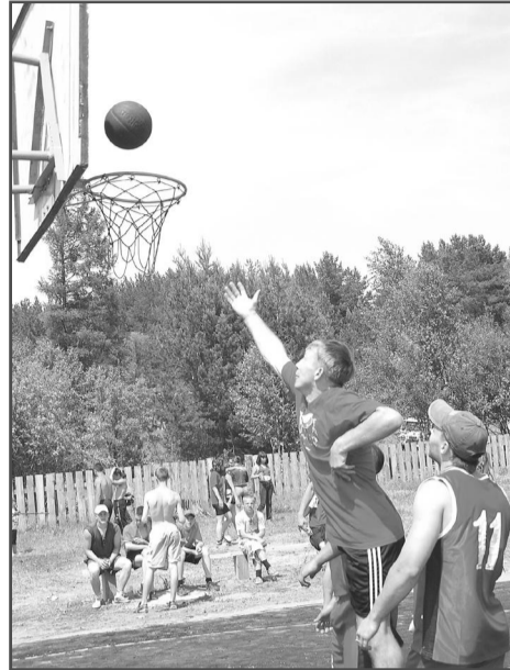
Мяч в корзине, гол забит!