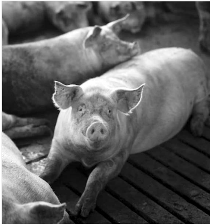
Летальный исход зараженных африканской чумой животных наступает с первых по пятые сутки.

Помните! Только строгое выполнение указанных рекомендаций позволит избежать заноса АЧС на ваши подворья и позволит избежать административной и уголовной ответственности.