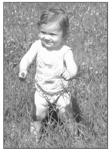
Жители села Вершинино забыли, когда здесь последний раз сыграли свадьбу. Соответственно, рождаемость низкая. Или, вернее, никакой. Эта малышка – единственный ребенок в селе в возрасте до года.

По данным Зеленополянкой сельской администрации, в селе Вершинино проживает 307 человек. Из них 80 – пенсионеры, население трудоспособного возраста составляет 175 человек, остальные – дети. С 2005 года в Вершинине родилось три человека, умер 21.