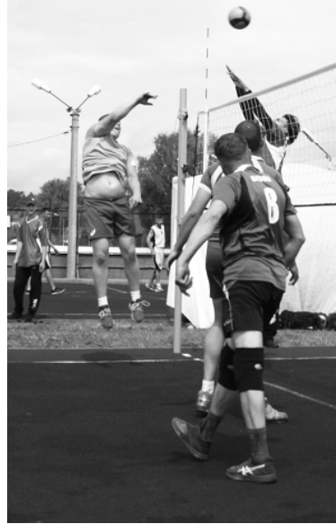
На летней районной олимпиаде-2022.

На центральном стадионе с 10 часов пройдут соревнования по классическому и пляжному волейболу, а также фестиваль ГТО, в котором примут участие трудовые коллективы района.