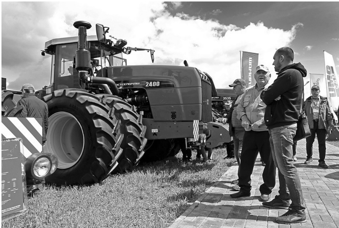
Аграриям представили не только технику,

В течение двух дней на агрофоруме обсудили цифровизацию сельского хозяйства, перспективы зернового рынка, а также другие аспекты, с которыми сталкиваются сельхозпроизводители. Кроме того,