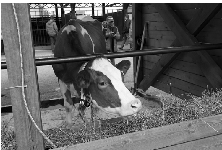
но и сельскохозяйственных животных.

участники увидели крупнейший агросалон России, где будут представлены все виды и образцы техники.