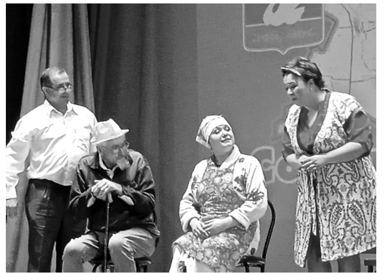
Сценка «Бабушка выходит замуж» в исполнении Советского народного театра вызвала в зале неудержимый смех и бурю аплодисментов.

Пожалуй, не многие знают, что с 2000 года существует замечательный праздник – День соседей, которому, по понятным причинам, наши гости уделили особое внимание и даже обратились к источникам, отметив, что на Руси всегда были сильны традиции коллективизма. Соседи зачастую помогали друг другу, строили всем миром, а по праздникам во дворах накрывали столы, и все от мала до велика радовались, пели, танцевали. А сегодня нам иногда легче общаться с человеком на другом краю земли, чем сказать «добрый день» своему соседу. Поэтому праздник, о котором идет речь, – это прекрасная возможность завести но-