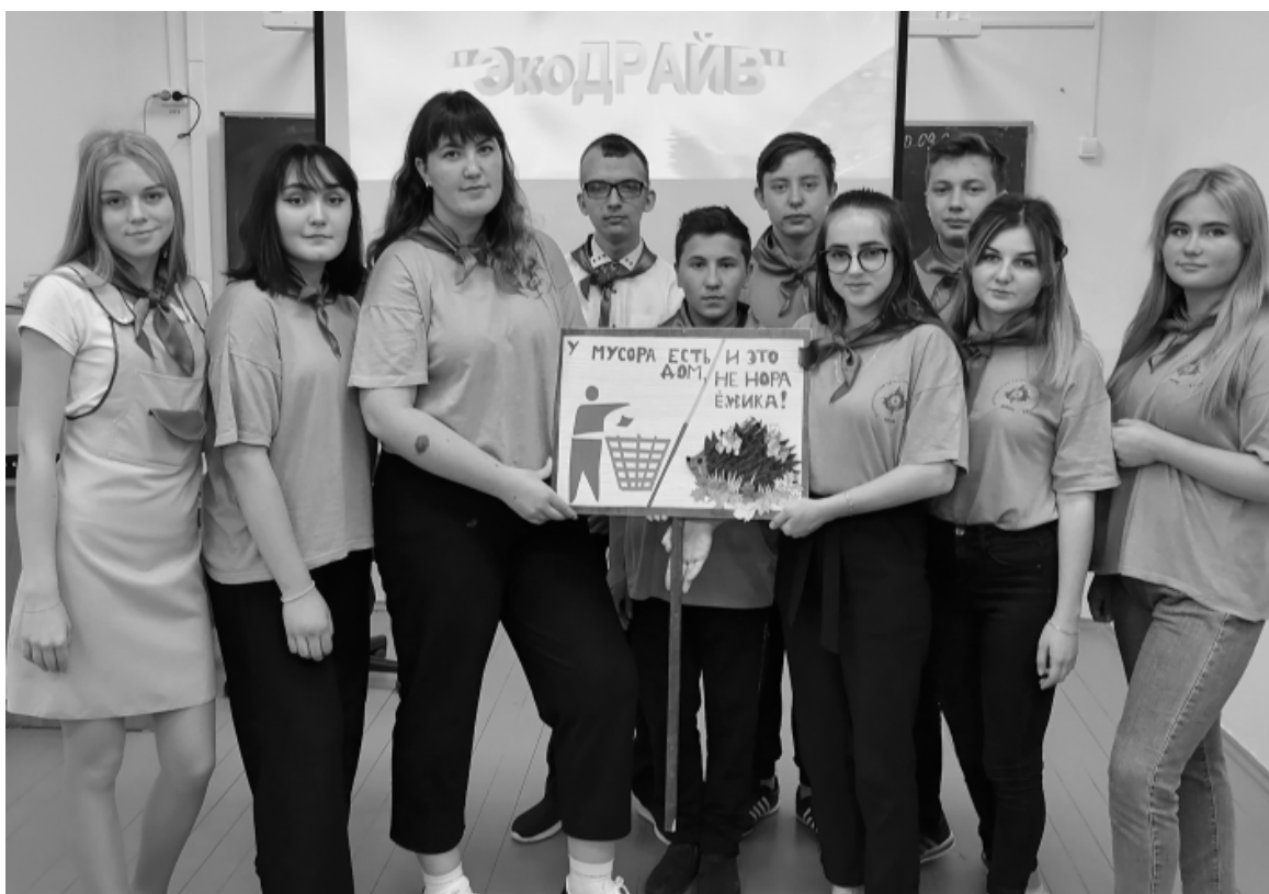
Команда Пролетарской школы, абсолютный победитель районного экологического слета «ЮнЭк», представляет социально-экологическую рекламу по защите и охране Ежкиного парка.

Ролики, посвященные сбору макулатуры, не похожи один на другой, но в каждом виден определенный «почерк». О каком почерке идет речь, догадаться сами. Одни прикольные, с «изюминкой», другие – деловые, а есть и просто «для галочки». От кого же это зависит, прежде всего, чтобы