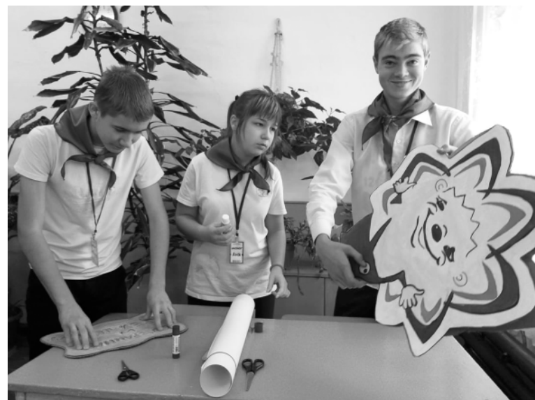
Увлекателен творческий процесс! Хорошее настроение не покидало ни на минуту ребят из команды Заводской школы.