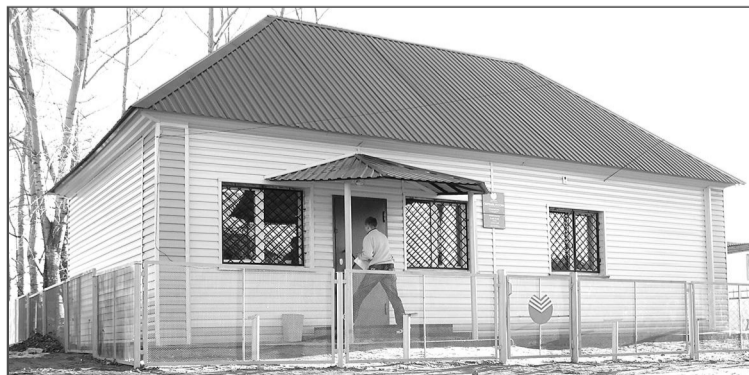
Обновленное здание операционной кассы в пос. Боровлянка удобно для клиентов, а его внешний вид радует взор местных жителей.

У нас обслуживается более 51 тысячи вкладчиков. Самые активные из них проживают в пос. Гордеевский – здесь больше всего жителей, которые обслуживаются в Сбербанке. А самые богатые вкладчики живут в Красноярах. Но независимо от размера вкладов мы всех рады будем обслужить и поможем преумножить капитал.