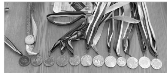
Ну, а завоеванные на соревнованиях медали, кубки и призы служат приятным дополнением к рыбалке.