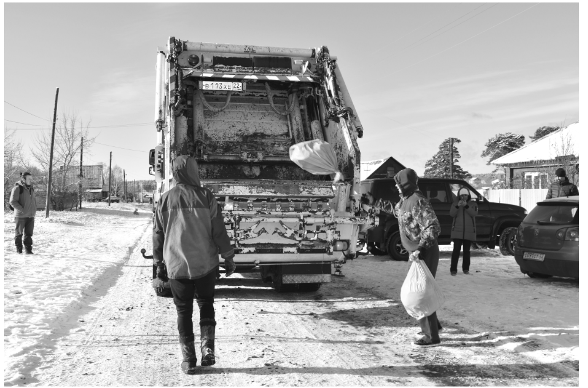
Регоператор и его подрядчики будут забирать все: и предоставляемые ими одноразовые пакеты, и собственную тару жителей. Но это — временное решение.

Региональный оператор отвечает за весь цикл обращения с отходами, и часто местные власти просто уходят в сторону от решения спорных ситуаций, — рассказывает