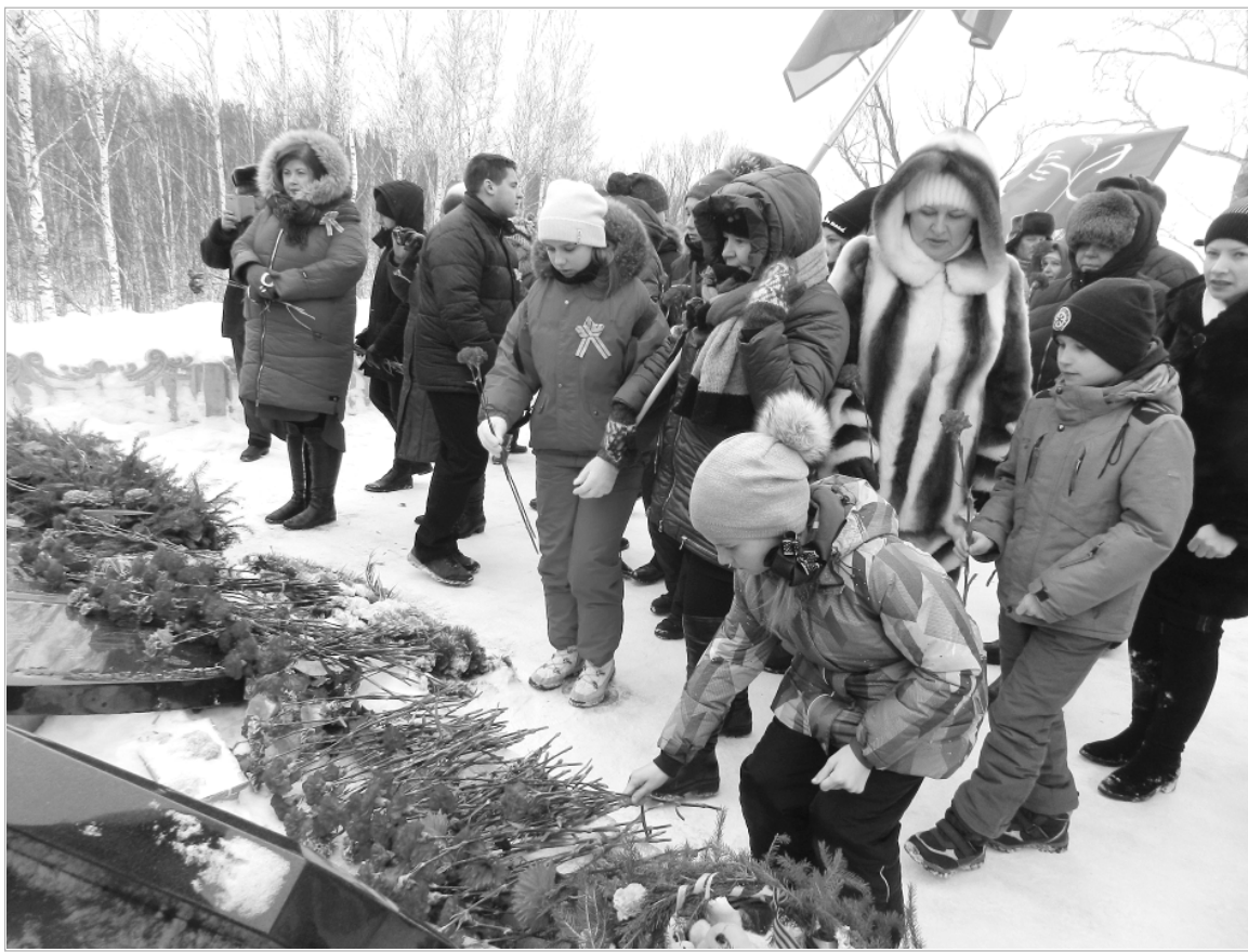
Почтить память ленинградских детей к мемориалу в Боровлянке пришли гости и местные жители.