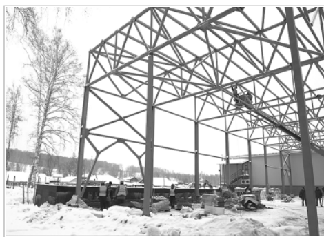
На территории завода «Троицкий маслосыророл» компании «Киприно» вовсю идет строительство.

— Мы делаем все, что сегодня позволяет законодательство РФ, включились в направления поддержки, разработанные на федеральном уровне. Есть несколько позиций, по которым край самостоятельно принимал решения, например, по возмещению части