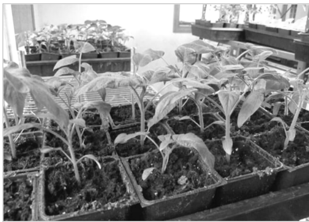
Совсем скоро на подоконниках будет тесно!

При посадке огородных культур учитывается и расположение Луны в определенном знаке Зодиака. На растущую Луну происходит активный рост тех растений, которые дают плоды на поверхности земли. В это время лучше всего заниматься посадкой и посевом томатов, огурцов, гороха, кабачков, баклажанов и прочих подобных культур. Когда ночное светило пребывает в стадии убывания, то в рост подаются корнеплоды. В эти дни займитесь посадкой свеклы, морковки, картошки и подобных культур.