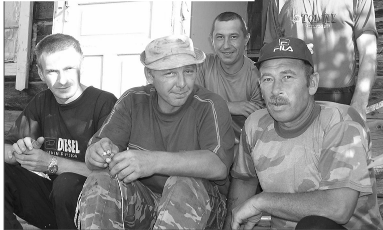
Бригада полеводцов Кипешинского отделения.

–Работать и знать, за что работать. Денег бы!