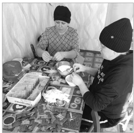
Волонтеры петровские и хайрюзовские за формированием посылок на фронт.

В преддверии Дня защитника Отечества в Хайрюзовке вновь проводится патриотическая акция «Подарок солдату». Она в очередной раз объединила всех желающих жителей села с активной жизненной позицией, взрослых и детей. В середине этой недели было готово к отправке более 60 подарков от жителей и Хайрюзовской средней школы. Они будут доставлены воинам в зону специальной военной операции к 23 Февраля. Цель акции «Подарок солдату» — оказать поддержку нашим воен-