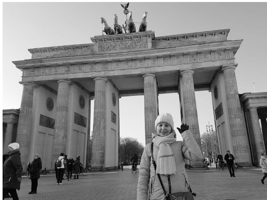
У Бранденбургских ворот.

Обратно к машине мы шли тем же путем. Бомжи под мостом улеглись спать, завернувшись в вонючие тряпки. Домой мы ехали под впе-