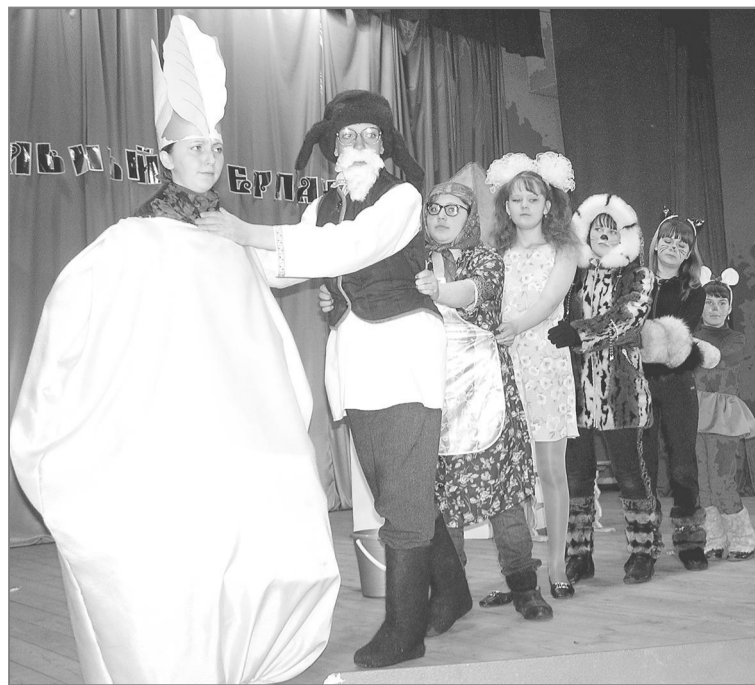
Театральный серпантин-2008: первые и, надо сказать, удачные шаги юных артистов из Горновской школы. Их постановка русской народной сказки «Репка» была по достоинству оценена жюри.