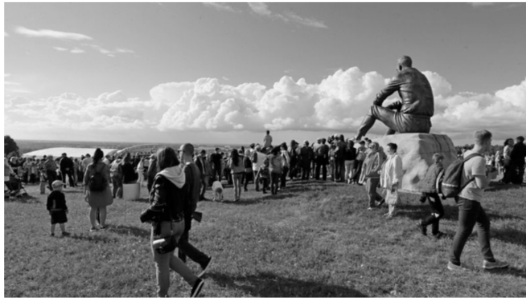
Без традиционного Пикета все же непривычно...

«Помимо прочих целей — собрать много гостей, сделать красивый праздник, пройтись артистам по ковровой дорожке и сделать творческие встречи — он (фестиваль. — Ред.) имеет другие цели: выделить те фильмы из современного кинематографа, по которым можно было бы для себя сформировать то культурное направление, которое мы подразумеваем под понятием «шукшинские фильмы» с девизом