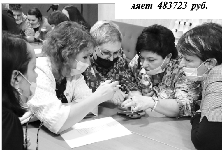
Так решаются командные задачи в игре.

Эти средства будут направлены на покупку сувенирной продукции и улучшение материальной-технической базы, на реализацию мероприятий проекта.