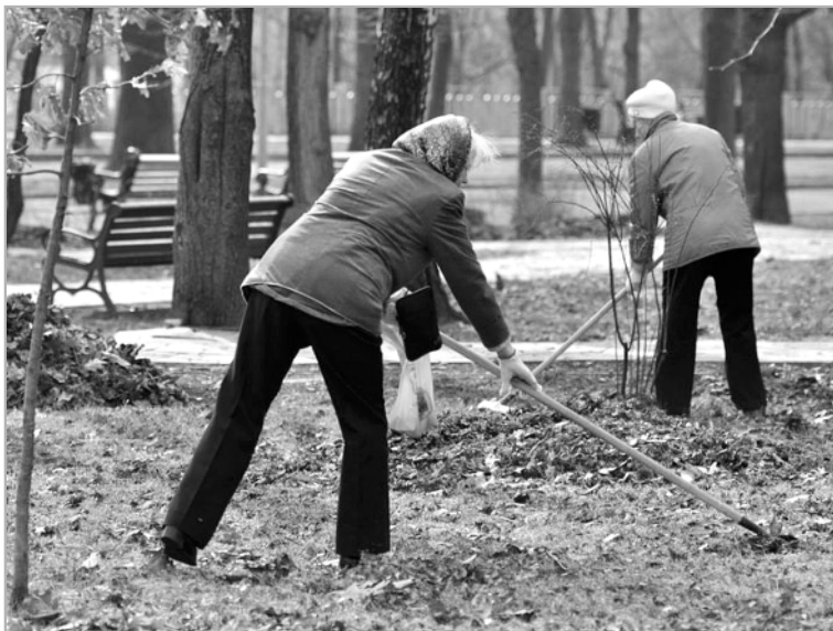
Нехитрое дело, но благое!..

-Содержать в чистоте наше большое замечательное село - прямая обязанность всех жителей. Ежегод-