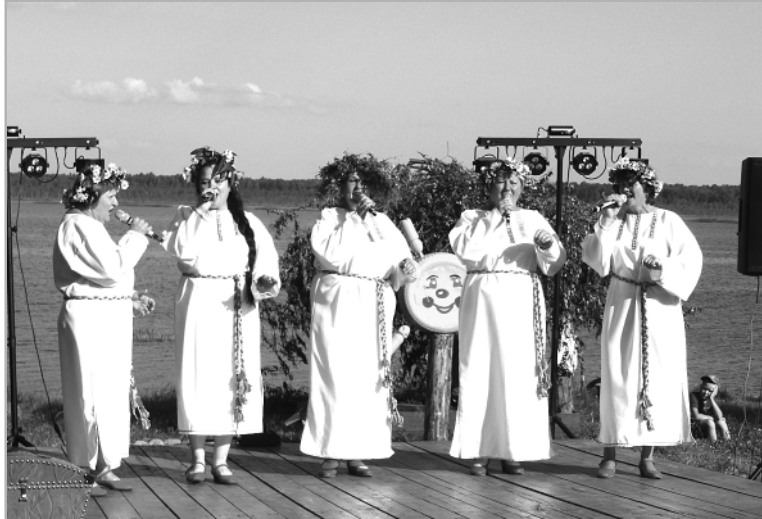
Все, кто на Озере побывал, отмечают: не зря!

А вот день Ивана Купалы еще называют праздником огня, поскольку огонь был символическим