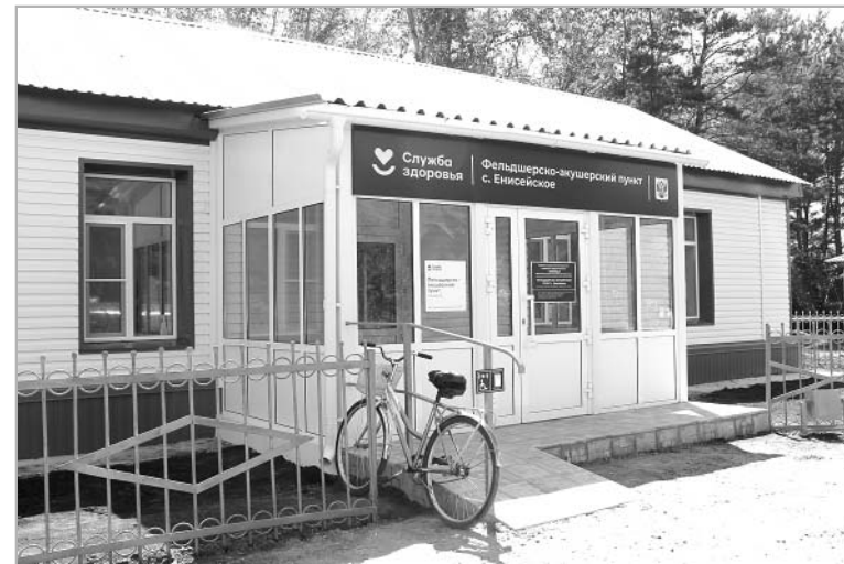
Новый ФАП в с. Енисейском.

В части закупки оборудования на 2022 год приобретено два рентгенологических аппарата в городскую поликлинику Барнаула и в Троицкую ЦРБ, а также