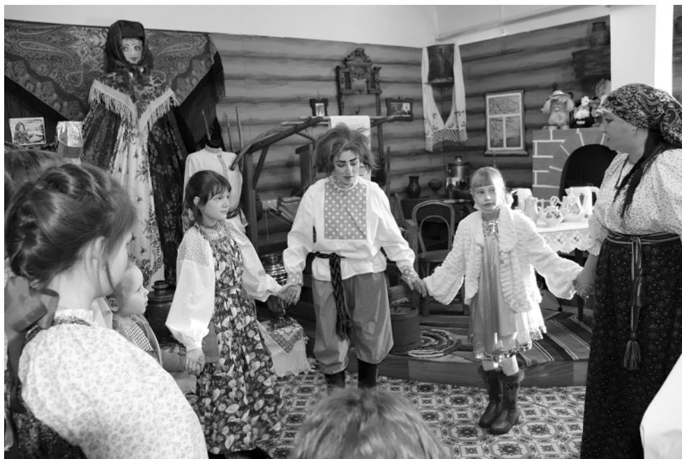
Игры с детьми были веселыми и увлекательными.