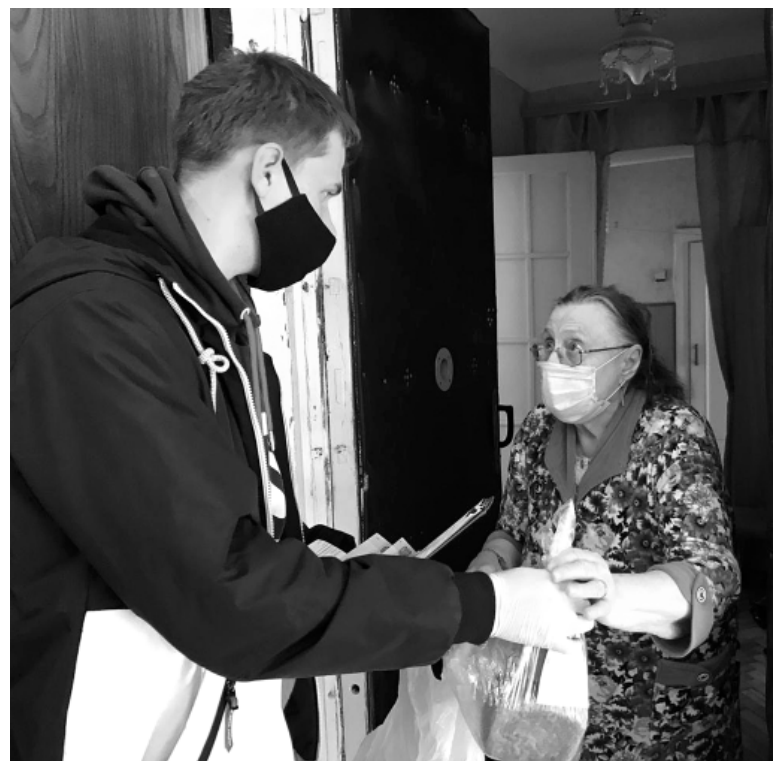
Помощниками пожилым, особенно в условиях пандемии, могут стать молодые, энергичные, мобильные люди.

«У меня и так неважное здоровье, а тут еще коронавирус! Дети, оберегая меня, реже стали приходить, больше теперь по телефону общаемся. Продукты приносят, но часто ведь не могут приходить, у самих работа, учеба, дом. Хорошо,