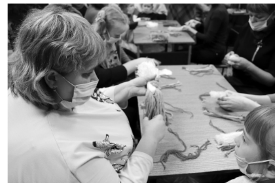
Как сделать своими руками куклу-оберег? Этому участники форума учились на мастер-классе в районном музее.

«Реализация проекта осуществляется за счет средств гранта губернатора Алтайского края в сфере молодежной политики» (#молодежьалтай, #алтаймолодой, #ам22, #регион22.).