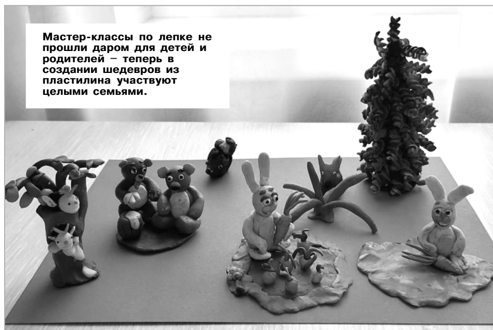
Мастер-классы по лепке не прошли даром для детей и родителей – теперь в создании шедевров из пластилина участвуют целыми семьями.