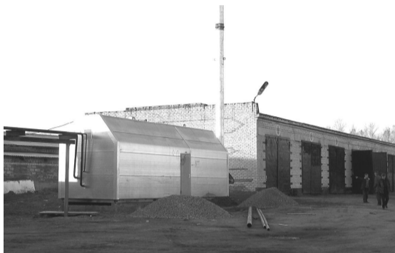
В два миллиона 66 тысяч рублей обошелся ДРСУ собственный газовый модуль.

когда-то разбитой трассе бийского направления, могут теперь все автолюбители. Выполнить та-