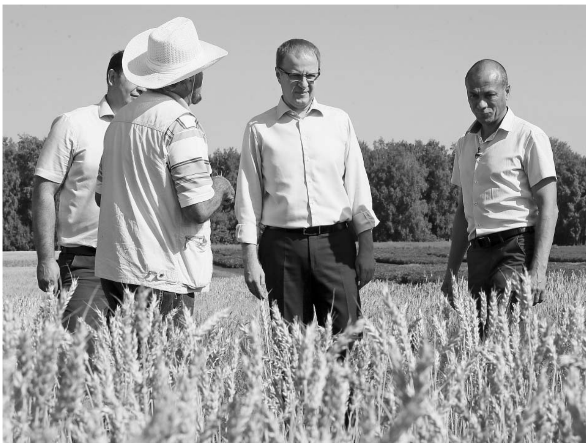
В Федеральном Алтайском научном центре агроботехнологий.

Импортозамещение в сфере семеноводства – одно из важных направлений в современных условиях. В Федеральном Алтайском научном центре агроботехнологий губернатору Виктору Томенко рассказали об уникальных сортах, вы-