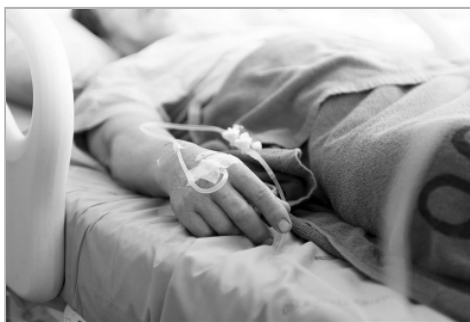
Новый день вступает в свои права, и все снова в ожидании от него чуда...

...Саша оказался в госпитале по моей вине.