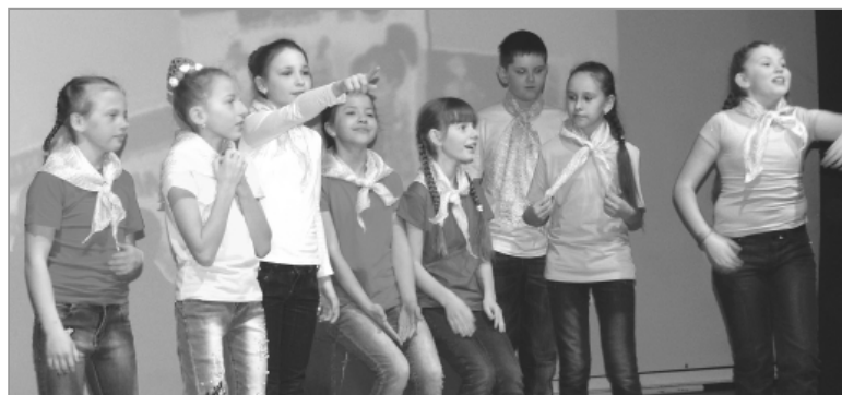
Спектакль «Девчонки» показал слаженность юных артистов из Троицкой школы №1 и прошел практически на одном дыхании.