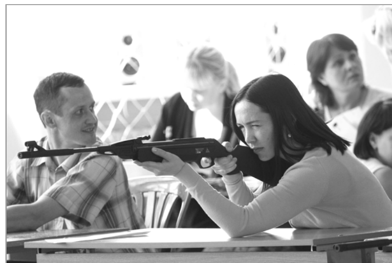
■ Количество присвоенных знаков отличия комплекса ГТО жителям Алтайского края

В 2017 году в регионе состоялось шесть мероприятий краевого и более 200 мероприятий муниципального уровней, предусматривающих выполнение нормативов ГТО. В зимнем и летнем фестивалях «Готов к труду и обороне» в общей сложности приняло участие более 10000 человек.