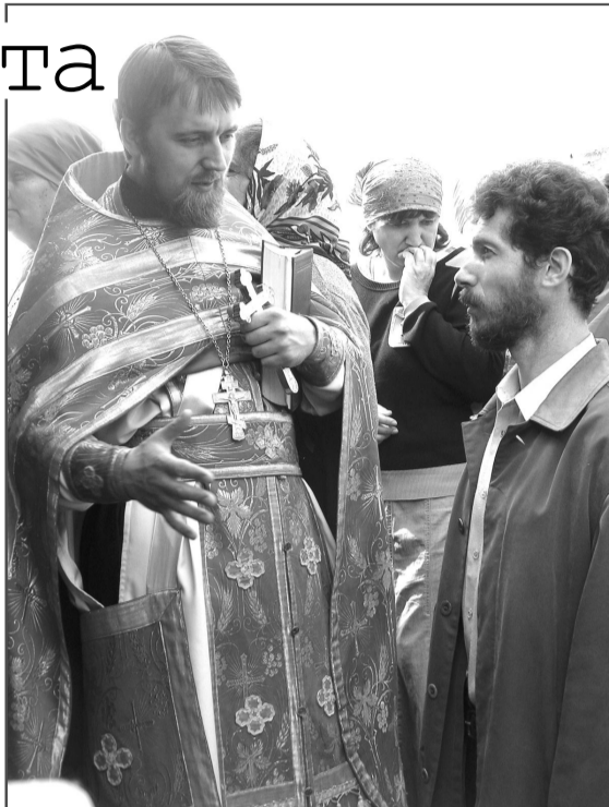
Желающие соблюдать пост должны посоветоваться с опытным духовником, рассказать ему о своем духовном и физическом состоянии, испросить благословения на совершение поста.

Входить в постование надо постепенно, начав хотя бы с воздержания от скоромной пищи в среду и пятницу в течение всего года. Некоторые необдуманно и поспешно берутся за подвиги поста и начинают поститься безмерно, строго. Вскоре у таких людей расстраивается здоровье или они от голода делаются нетерпеливы и раздражительны. Пост становится для них невыносимым, и они