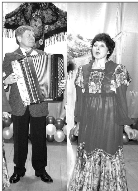
Члены клуба «Лада».