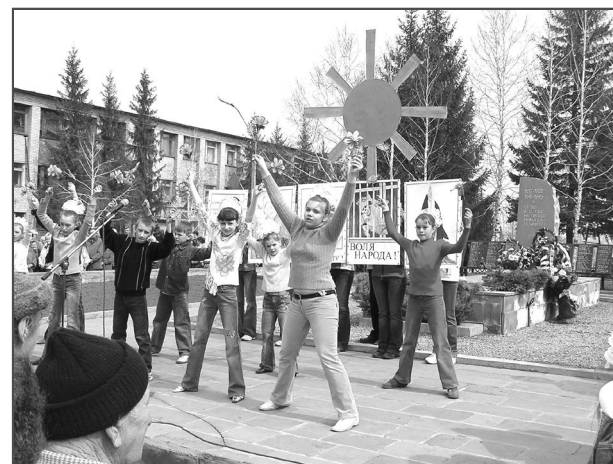
НА СНИМКАХ - День Победы в с. Троицком в 2006 г.