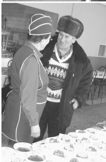
Постоянные посетители столовой в этот день были приятно удивлены разнообразным выбором блюд.