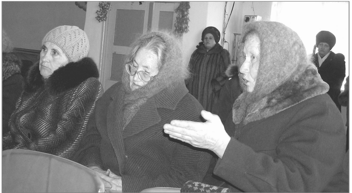
На многие наболевшие для населения вопросы отвечать приходилось главе района...

Учителей Петровской средней школы не устроил некачественный, по их мнению, медосмотр учащихся в школе и то, что педагогов принуждали делать прививки от гриппа. В очередной раз главе пришлось выслушать нарекания в адрес вра-