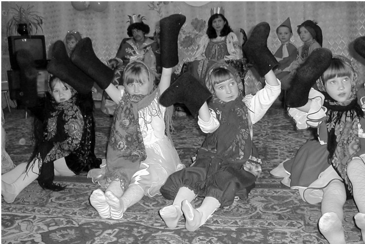
Фото из архива редакции (ноябрь 2003 г.).

Это интересно Любви все возрасты покорны?