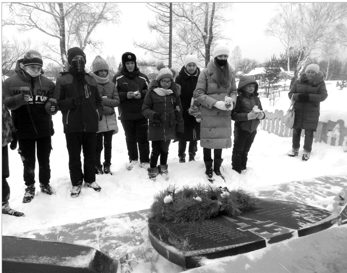
У мемориала детям блокадного Ленинграда в Боровлянке.