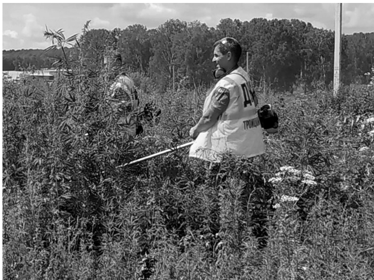
При непосредственном участии народных дружинников, сотрудников полиции и администрации Троицкого сельсовета в селе Троицком на площади 660 квадратных метров была выявлена и уничтожена дикорастущая конопля.

В 2020 году представители народной дружины провели шесть мероприятий по охране общественного порядка, участвовали в работе координационных, консультативных, экспертных и совещательных органов (советов, комиссий) по вопросам охраны общественного порядка, создаваемых в органах внутренних дел (полиции). Народные дружинники участвовали в пресечении административных правонарушений (семь случа-