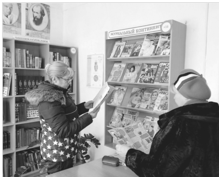
Районная библиотека: здесь каждый найдет для себя издание по душе.

Здесь каждый найдет себе газету или журнал по душе. Представители старшего поколения помнят время, когда приобретение книг для домашних библиотек было массовым, а выписать популярный журнал считалось большой удачей. Огромным спросом у населения пользовались журналы «Сельская новь», «Приусадебное хозяйство», «Верена», «1000 советов» и множество других. Для большинства граждан день начинался с прочтения газет «Алтайская правда», «На земле троицкой», «АиФ». Сегодня читальный зал предлагает своим читателям не только журналы «с биографией», но и современные. Например, «ФиС» («Физкультура и спорт»), «Домашний очаг», «Мото», «Лиза».