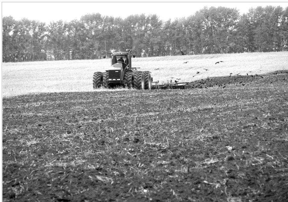
Чтобы отдача от каждого гектара была максимально возможной, надо вложить в землю немало средств. И сил...

–В Дундихинском урочище много лет земля не работала, но с приходом в наш район ООО «Троицкий бычок» будем земли запаса вводить в оборот и оформим на это хозяйство, которое базируется в Песьянке. За долгие годы появились сложности в их освоении – многие участки заросли, как пашню их использовать нерационально, да и мало кто возьмется. Там, где когда-то была пашня, теперь в лучшем случае сенокос. Но все равно стараемся вовлечь и эти земли в работу. Отмечу, что в последние годы земля стала более востребована, особенно в восточной части района, там можно давать земли сколько угодно, и ее всю разберут фермеры. Многие фермеры не только желают взять землю, но и готовы ее восстанавливать.