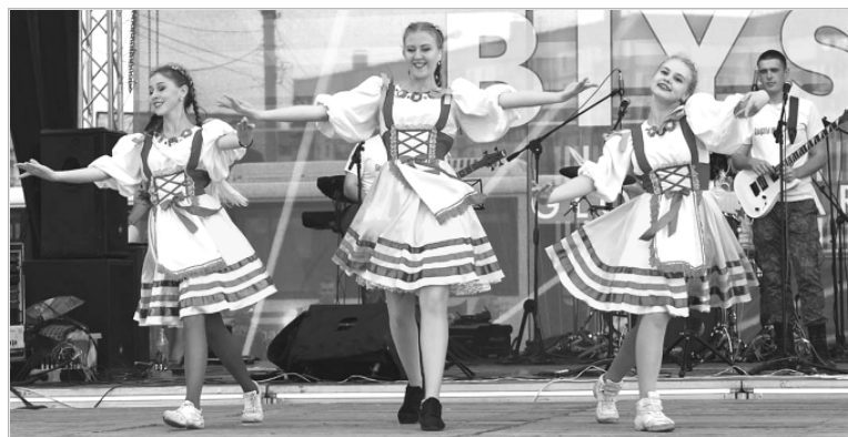
ФОТО С ПРОШЛОГО ФЕСТИВАЛЯ, 2017 год.

ПОДРОБНЕЕ об условиях участия в конкурсной программе можно узнать в положении о фестивале на сайте Фонда Александра Прокопьева.