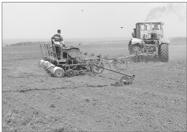
Даже если земля «работает», но право на нее официально не зарегистрировано, по закону она считается неустраиваемой.