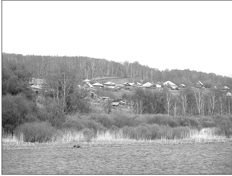
Осенью на ельцовском пруду сможет посидеть с удочкой любой желающий.

– На обратном пути, когда машина проезжала пост ГАИ за Бийском, сотрудники ГИБДД ее остановили. В кузове стояла бочка с мальками, а рядом – кислородный баллон, для подпитки, чтобы рыба не задохнулась. Милиционер и спрашивает: «Что это за самогонный аппарат?». Когда ему объяснили, он быстро отпустил машину, дав