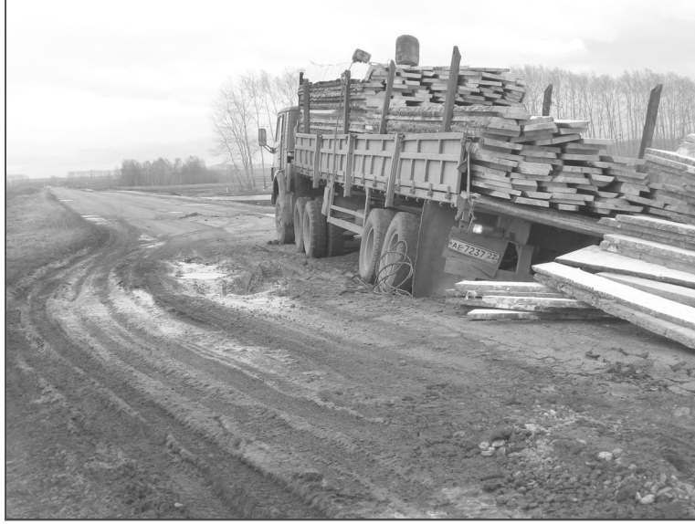
После проезда под запрещающий знак КамАЗ провалился по самую ось...