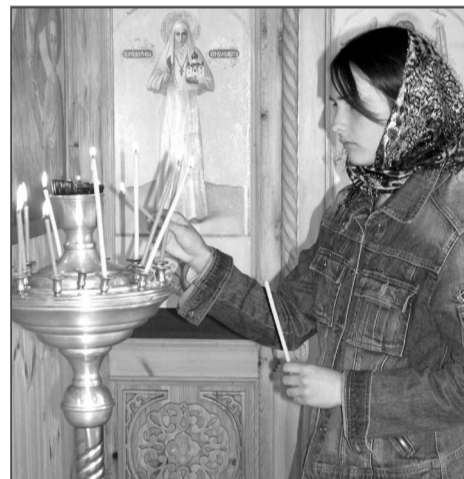
Когда храм опустел, есть возможность осмотреть его, поставить свечу и помолиться в тишине и покое.

На радость всем купающимся, солнце окончательно разгоняет тучи и начинает припекать. Тем временем в монастыре в летней столовой под навесом угощают обедом всех желающих. На дворе Петровский пост, который заканчивается 12 июля. И поэтому на обед – салаты с растительным маслом, очень вкусные борщ и картофельное пюре с рыбой. Пытаюсь разгадать секрет ароматного подлива с грибами. На столе – морс, квас, компот.