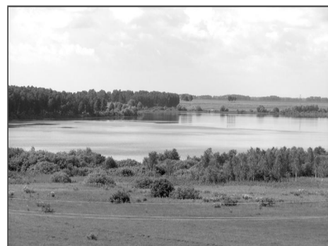
Мученическое озеро – место скорбное и красивое.