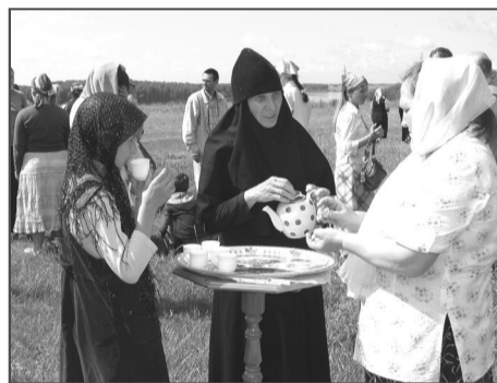
Первое, что вкушают православные христиане после причастия, – кусочек просфоры и глоток святой воды.

Тут же, на улице, два священника принимают исповедующихся.