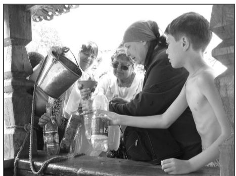
Вода в Святом источнике считается целебной. Ее черпали, черпали...

Несколько лет назад мы уже рассказывали на страницах нашей газеты о Мученическом озере. Напомню, что во времена репрессий в период 20-30-х годов прошлого века в Сорочьем логу проходили массовые расстрелы верующих мирян и духовенства. Священнослужителей в зимнюю стужу под дулами пистолетов загнали в ледяную воду. Но вера в Бога укрепляла их. Большевики, кутаясь в полушубки и замерзая, не стали дожидаться смерти невинных и расстреляли их. Поэтому озеро и зовется Мученическим.