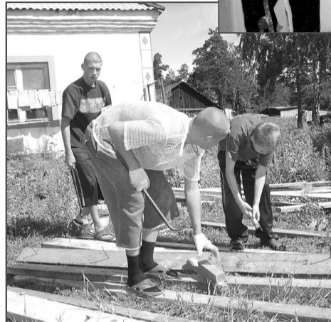
Бережливость – главное качество ремонтника. Гвозди лишними не бывают.

26 и 27 июня на базе детского лагеря «Бригантина» прошел сбор-учеба актива лидеров. На сбор приехали школьники 13-15 лет почти со всего района. А собрались они для того, чтобы пообщаться и суметь проявить качества лидера. Вместе с ребятами приехали «позучиться» и отдохнуть организаторы мероприятия и вожатые.