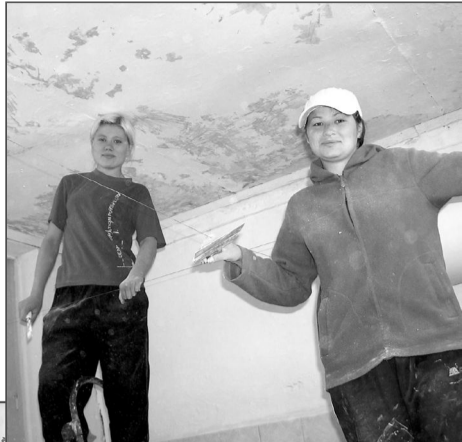
С мастерком под потолком мы починим дом!

В это время еще 15 школьников организовали оздоровительный лагерь под названием «Веселье ребят» со специальной программой на месяц, а двое отдыхали на площадке при ТСШ № 2.