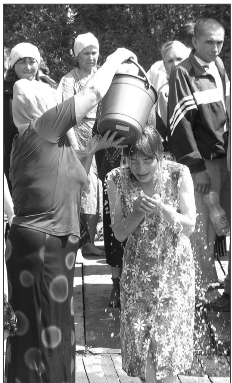
А потом обливались, принимая это как благодать Божию.