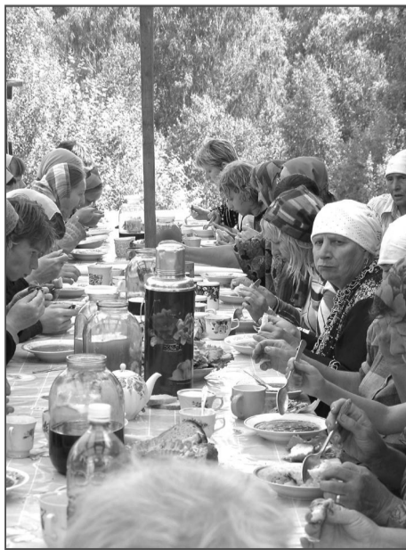
Всех желающих приглашали отобедать в монастыре. Несмотря на большое количество гостей, вкусного борща хватило всем.

Едва завершается церемония награждения, как люди устремляются к источнику. Черпают воду ведрами, бутылками, банками. Обливают друг друга. Некоторые решаются окунуться в ледяную воду.