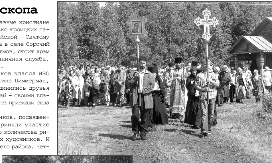
Крестный ход к Святому источнику.