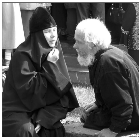
Миряне с любопытством расспрашивают монахинь об их образе жизни.

Поднимаясь на холм, ребята осматривают местность. Вдали виднеется озеро. На вершине холма – храм. Девушки повязывают платочки, вспомнив, что в храм женщинам положено входить с покрытой головой. Но в церковь попасть не удастся. Народу столько, что во время службы многие вынуждены стоять под окнами храма, слушая пение хора.