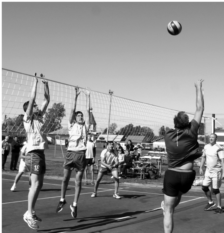
Встреча команд ветеранов и молодежи.

Игра проходила с переменным успехом — то одна команда вырвалась вперед, то другая. Наклад спортивной страсти и азарт сопровождали всю игру, правда, коррективы вносил сильный ветер, он иногда изменял траекторию движения мяча, но никто не жаловался. Как сказал один из участников