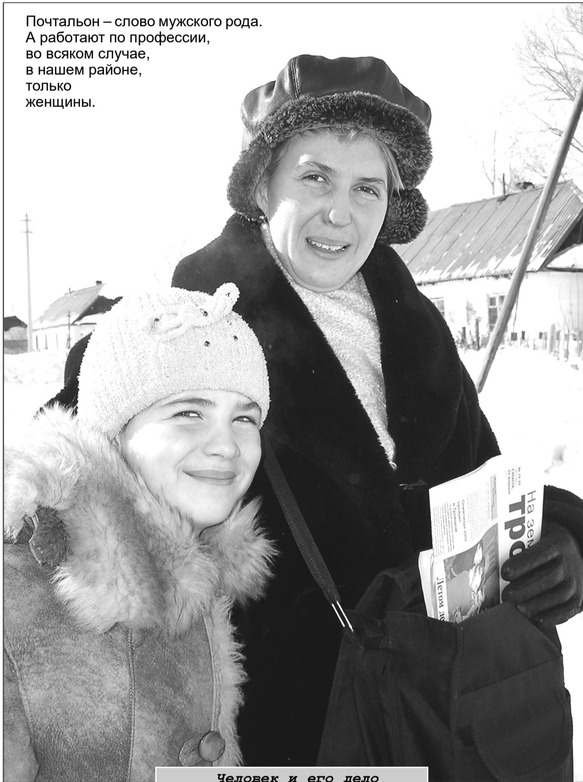
Человек и его дело

Почтальон – слово мужского рода. А работают по профессии, во всяком случае, в нашем районе, только женщины.