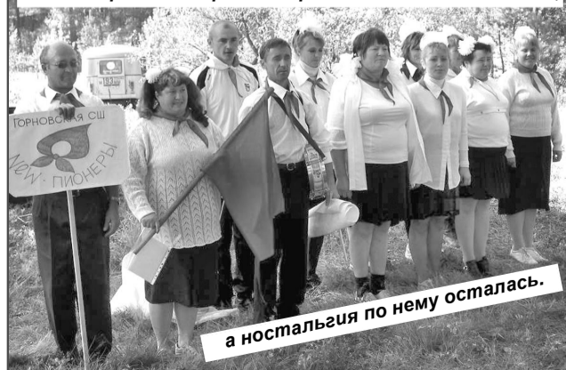
а ностальгия по нему осталась.