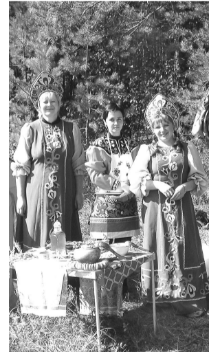
«Русичи гостеприимны, вот такие с детства мы» – таков девиз беловских учителей.