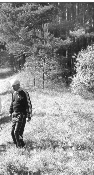
Ура! Ни звонков, ни учеников!

Спортивные конкурсы, свежий воздух и соблазнительные запахи полевых кухонь нагоняли аппетит. Пришло время состязания поваров. Лучшей была признана кухня «Тонуса». Второе место разделили две петровские команды – «Шкрабы» и