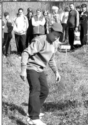
Пусть болото под ногами и условное, но оступиться никто не хотел.

«Клумба» – и красноярские «Чудаки», а третьей стала «УЕ» из Ельцовки. Четвертое место отдано ТСШ №1, а вот на пятом разместились аж