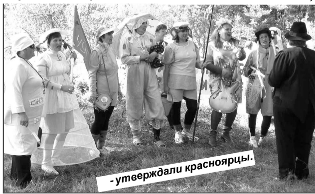
– утверждали красноярцы.

«Чудачество и ребячество – наши главные качества»,