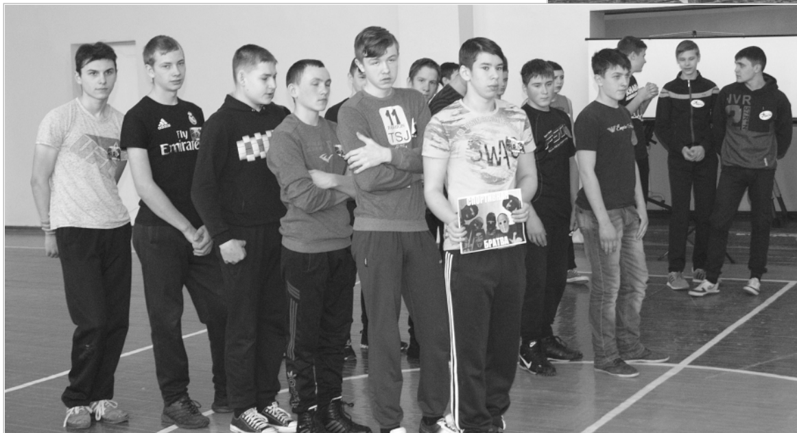
Три команды школы, ученики восьмых, девярых и десятых классов, приветствовали команду ветеранов боевыми кричалками.

В МЕСТНОМ ОТДЕЛЕНИИ Российского Союза ветеранов Афганистана (а кроме воинов-«афганцев» активистами являются и участники войны в Чечне) давно сложились свои традиции. Одна из них — ежегодно встречаться со школьниками и студентами, чтобы рассказать им о войне, ответить на вопросы, пообщаться в живую в торжественной и неформальной обстановке. Вот и нынешняя акция обязательно будет проходить с участием школьников.