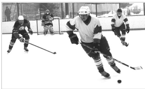
Шайба – у игроков троицкой команды.

Команды Троицкого, Тальменского, Петропавловского и Косихинского районов играли по системе «каждый с каждым». Наши забросили первую шайбу турнира – в ворота косихинской команды, но в результате игра тройчана смогли занять только третье место. В финал олимпиады вышла команда Тальменского района, второе место заслужили парни из Петропавловского района, а четвертое место досталось хоккеистам из Косихи.