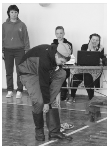
Не так-то просто одеться по уставу...

Конкурсы-задания — бег с мячом, в противогазе, одевание солдатской формы по уставу и на время, поднимание гири и перетягивание каната — проходили под дружную поддержку болельщиков. Конечно, за каждое состязание на-