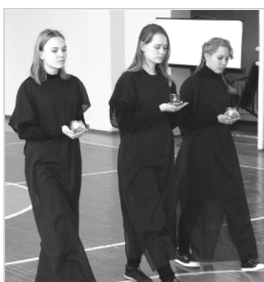
Школьницы подготовили танец, который стал частью патриотической акции.

Концерт, посвященный памятной дате, начался в 12 часов в клубе. В фойе можно было посмотреть