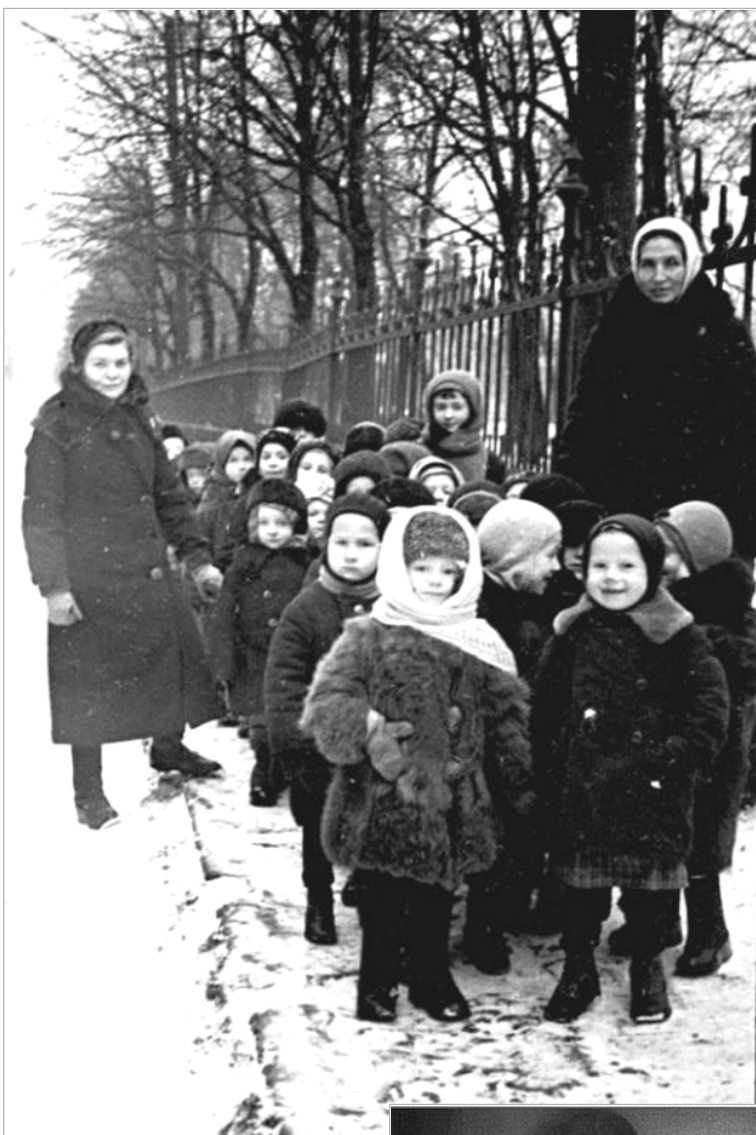
Мало кому из этих эвакуированных из осажденного Ленинграда малышей будет суждено вернуться в родной город... Оставшихся ждали холод и голод.

Торжественные мероприятия пройдут в этот день не только в городах, но и в селах России.